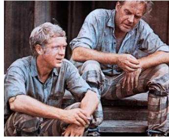
1965 NEVADA SMITH (Nevada Smith) d'Henry Hathaway avec Steve McQueen