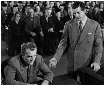
1946 BOOMERANG (Boomerang !) d'Elia Kazan avec Dana Andrews