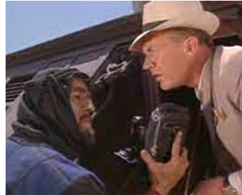
1962 LAWRENCE D'ARABIE (Lawrence of Arabia) de David Lean avec Anthony Quinn