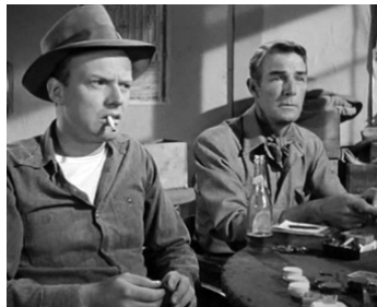
1948 LES AVENTURIERS DU DÉSERT (The Walking Hills) de John Sturges avec Randolph Scott