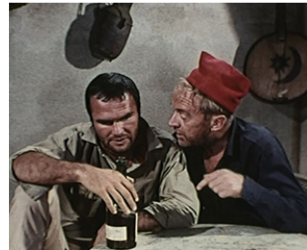
1969 SHARK ! (Maneater) de Samuel Fuller avec Burt Reynolds