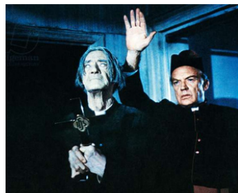
1976 LA SENTINELLE DES MAUDITS (The Sentinel) de M. Winner avec John Carradine