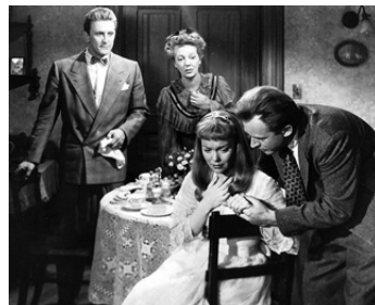
1950 LA MÉNAGERIE DE VERRE (The glass Menagerie) d'I. Rapper avec K. Douglas, G. Lawrence, J. Wyman