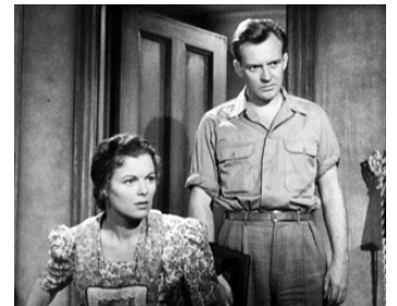
1949 UNE INCROYABLE HISTOIRE (The Window) de Ted Tetzlaff avec Barbara Hale