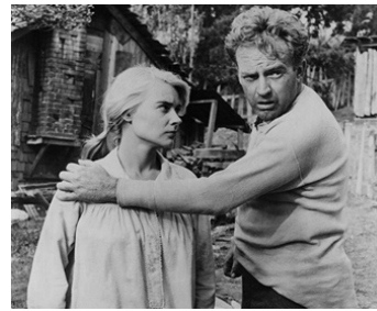
1957 LES PLAISIRS DE L'ENFER (Peyton Place) de Mark Robson avec Hope Lange