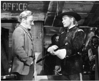
1941 LA CHARGE FANTASTIQUE (They died with their Boots on) de R. Walsh avec Errol Flynn