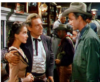
1951 LES AFFAMEURS (Bend of the River) d'Anthony Mann avec Julie London, J. Stewart