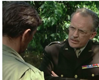
1967 LA BATAILLE POUR ANZIO (Anzio) d'Edward Dmytryk avec Robert Mitchum