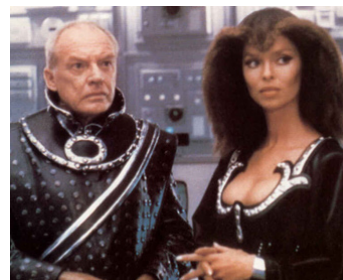
1979 L'HUMANOÏDE (L'umanoide) d'Aldo Lado avec Barbara Bach