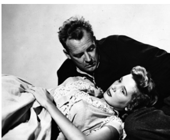
1954 LES ASSASSINS MEURENT AUSSI (Crashout) de Lewis R. Foster avec Beverly Michael