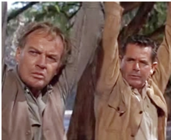
1967 LE JOUR DES APACHES (Day of the Evil Gun) de Jerry Thorpe avec Glenn Ford