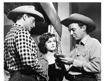
1952 LES INDOMPTABLES (The Lusty Men) de Nicholas Ray avec R. Mitchum, S. Hayward