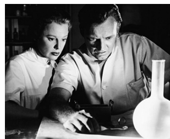
1952 LA JEUNE FILLE EN BLANC (The Girl in White) de John Sturges avec June Allyson