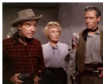
1951 L'ANGE DES MAUDITS (Rancho Notorious) de Fritz Lang avec M. Dietrich, Mel Ferrer