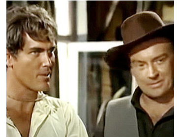
1964 MURIETA (Joaquin Murrieta) de George Sherman avec Jeffrey Hunter