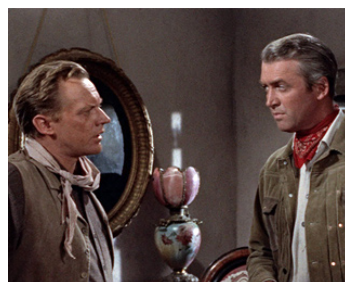
1954 L'HOMME DE LA PLAINE (The Man from Laramie) d'A. Mann avec D. Crisp, J. Stewart