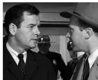
1955 LA MAISON DES OTAGES (The Desperate Hours) de William Wyler avec Gig Young