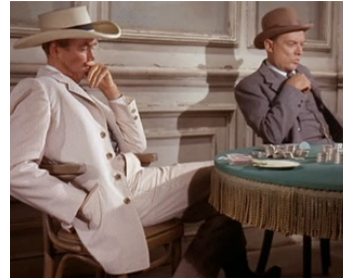
1963 LES CHEYENNES (Cheyenne Autumn) de John Ford avec James Stewart