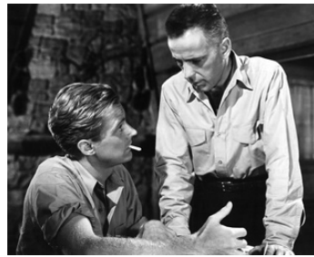
1940 LA GRANDE ÉVASION (High Sierra) de Raoul Walsh avec Humphrey Bogart