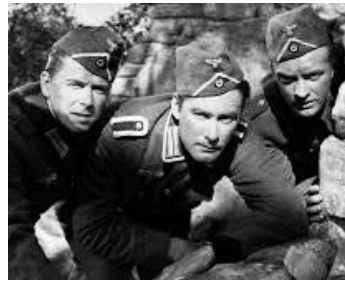
1942 SABOTAGE À BERLIN (Desperate Journey) de Raoul Walsh avec R. Reagan, Errol Flynn