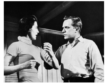
1958 CRÉPUSCULE SUR L'OcéAN (Twilight for the Gods) de Joseph Pevney avec Cyd Charisse