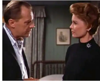
1959 ILS N'ONT QUE VINGT ANS (A Summer Place) de Delmer Daves avec Troy Donahue