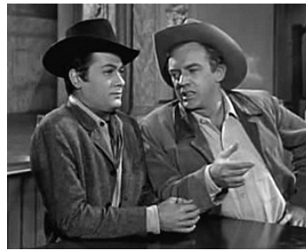
1956 LES ANNÉES SAUVAGES (The Rawhide Years) de Rudolph Maté avec Tony Curtis