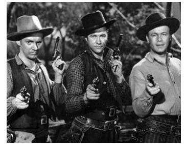
1941 BANDITS D'HONNEUR (Bad Men of Missouri) de Ray Enright avec Dennis Morgan, Wayne Morris