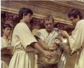
1961 BARRABAS (Barraba) de Richard Fleischer