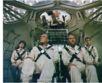
1966 LE VOYAGE FANTASTIQUE (Fantastic Voyage) de R. Fleischer avec D. Pleasence, Stephen Boyd