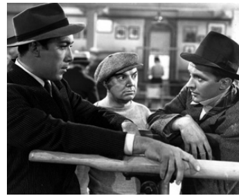
1940 KNOCK OUT (Right to the Heart) de William Clemens avec Anthony Quinn