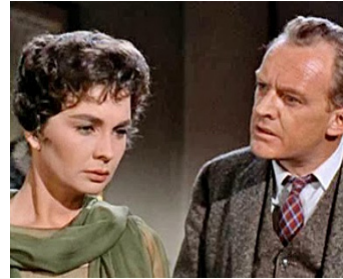
1960 ELMER GANTRY, LE CHARLATAN (Elmer Gantry) de Richard Brooks avec Jean Simmons