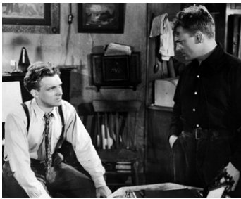
1940 VILLE CONQUISE (City of Conquest) d'Anatole Litvak avec James Cagney