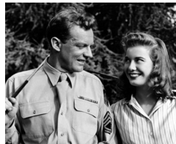
1951 LA NOUVELLE AURORE (Bright Victory) de Mark Robson avec Peggy Dow