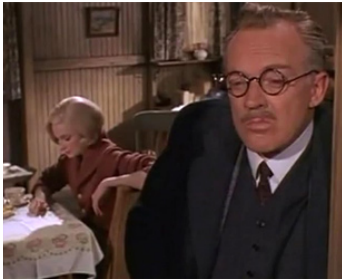
1964 L'AMOUR EST MERVEILLEUX (Joy in the Morning) d'Alex Segal avec Yvette Mimieux