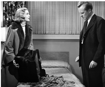
1949 LA TIGRESSE (Killer Bait) de Byron Haskin avec Lizabeth Scott