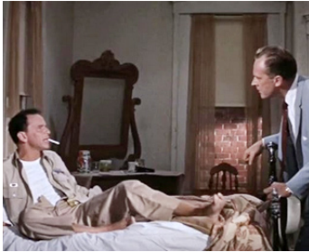
1958 COMME UN TORRENT (Some came running) de Vincente Minnelli avec Frank Sinatra