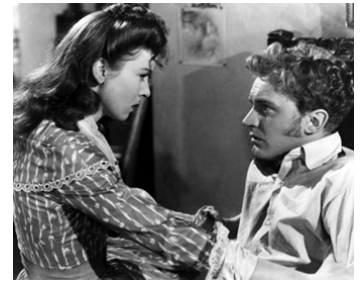
1946 LA VIE PASSIONNÉE DES SŒURS BRONTË (Devotion) de Curtis Bernhardt avec Ida Lupino