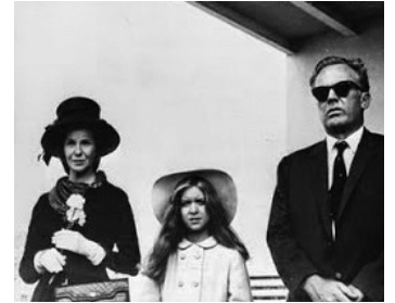
1967 L'ENFANT DU LUNDI (Monday's Child) de Leopoldo Torre-Nilsson avec Geraldine Page