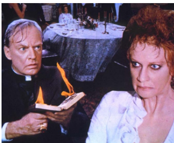
1974 L'ANTÉCHRIST (L'antecristo) d'Alberto De Martino avec Carla Gravina