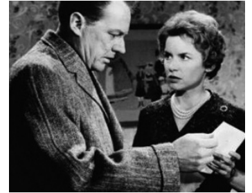
1961 LE TRAIN DE 16 HEURES 50 (Murder, she said) de George Pollock avec Muriel Pavlow