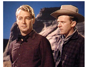
1951 LA MONTAGNE ROUGE (Red Mountain) de William Dieterle avec Lizabeth Scott