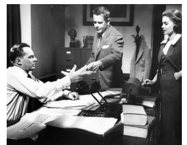
1955 LE PROCÈS (Trial) de Mark Robson avec Glenn Ford, Dorothy McGuire